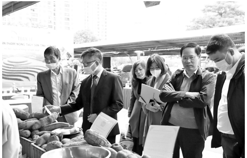
Lãnh đạo Sở Công thương tỉnh Yên Bái cùng Sở Công thương Hà Nội và Tập đoàn Central Retail Việt Nam tham quan các gian hàng nông sản của Yên Bái

Tại Lễ khai mạc tuần hàng, khách hàng sẽ