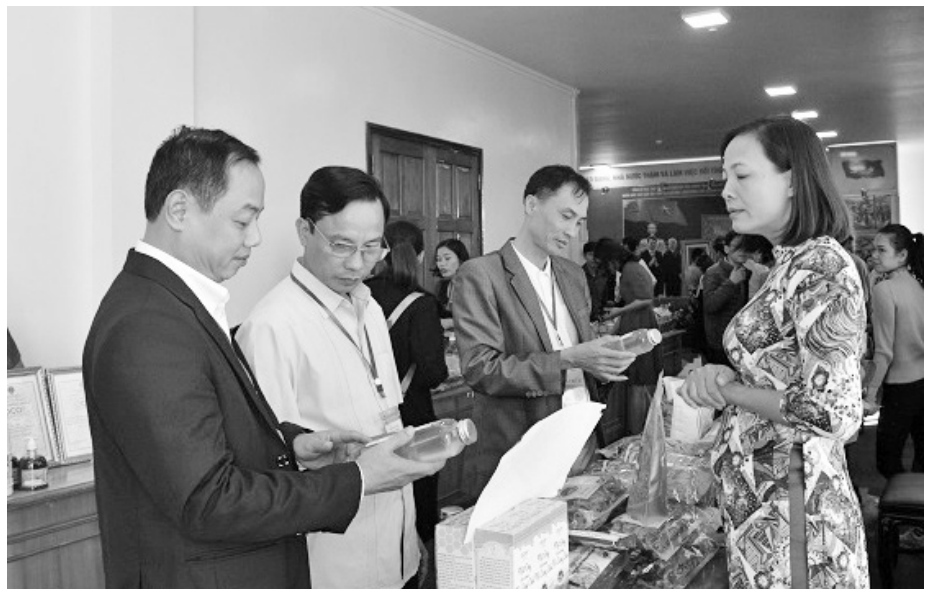
Các đại biểu tham quan các gian hàng trưng bày sản phẩm đặc sản của các tỉnh