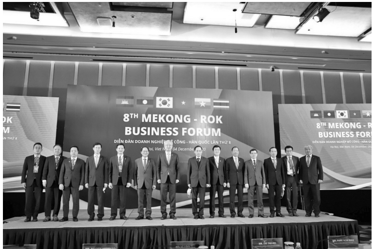
Lãnh đạo Bộ Ngoại giao Việt Nam, Hàn Quốc chụp ảnh cùng với các đại biểu các tổ chức, các địa phương tham dự diễn đàn

trung thảo luận về vai trò của doanh nghiệp vừa và nhỏ.... Mặc dù bị ảnh hưởng của đại dịch Covid-19, các doanh nghiệp vừa và nhỏ vẫn đóng vai trò động lực chính, giúp các nền kinh tế vượt qua khủng hoảng từ đại dịch. Do vậy, các đại biểu đã tập trung thảo luận bàn các biện pháp, chính sách của Chính phủ, các nỗ lực của doanh nghiệp vừa và nhỏ, vai trò của hợp tác Mê Công - Hàn Quốc và các cơ chế chính sách, sáng kiến hợp tác khu vực để giúp đỡ các doanh nghiệp