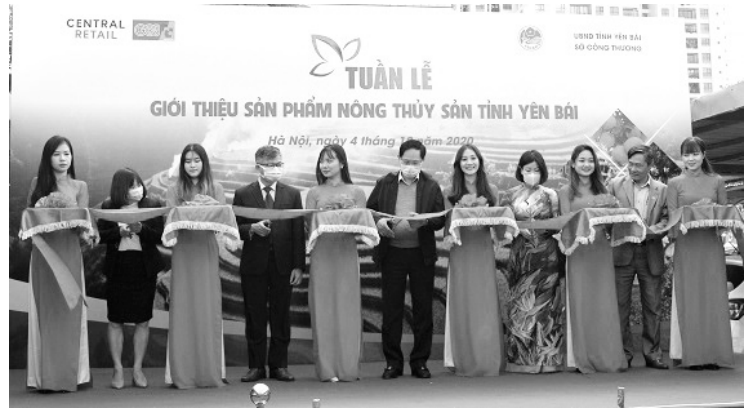
Khai mạc Tuần Lễ giới thiệu sản phẩm nông, thủy sản tỉnh Yên Bái tại Siêu thị BigC Hà Nội

Tuần lễ sẽ quảng bá, giới thiệu các sản phẩm nông, thủy sản có thể mạnh của tỉnh Yên Bái, với điểm nhấn là các sản phẩm đặc sản của huyện Yên Bình (bưởi Đại Minh, cá hồ Thác Bà, gạo Bạch Hà,...) đến đông đảo người tiêu dùng tại Hà Nội, góp phần tích cực hưởng ứng cuộc vận động “Người Việt Nam