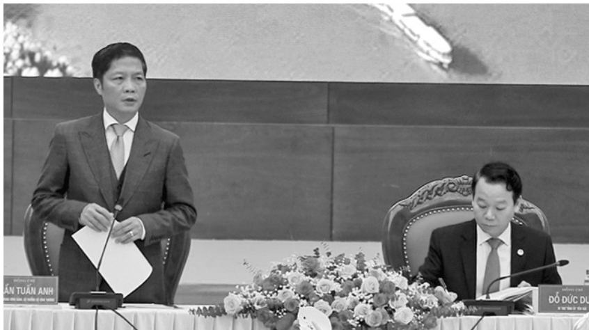
Bộ trưởng Bộ Công Thương Trần Tuấn Anh phát biểu kết luận Hội nghị

Tuy nhiên, đồng chí Bí thư Tỉnh ủy cũng chỉ rõ, phát triển công nghiệp, thương mại và dịch vụ tại Yên Bái nói riêng và các tỉnh khu vực trung du và miền núi phía Bắc nói chung vẫn còn nhiều khó khăn, thách thức. Do đó, để khơi thông các điểm nghẽn giúp Yên Bái và các tỉnh