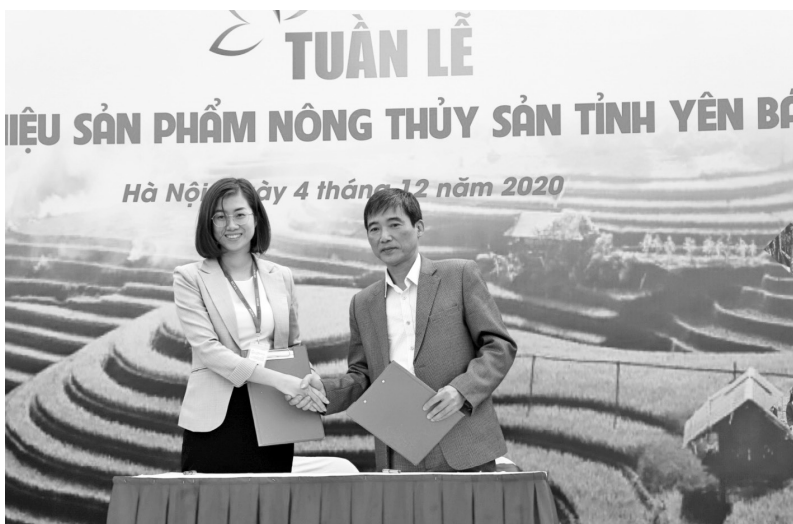
Lễ ký kết biên bản ghi nhớ hợp tác giữa Trung tâm Khuyến công và Xúc tiến thương mại tỉnh Yên Bái và Big C Thăng Long Hà Nội.