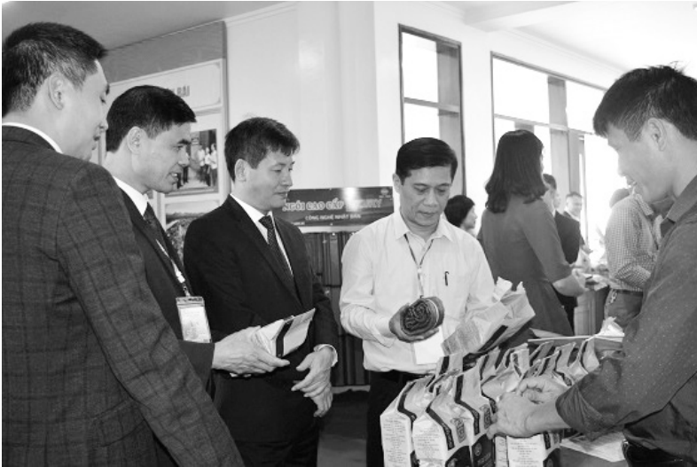
Đồng chí Ngô Hạnh Phúc - Phó Chủ tịch UBND tỉnh và các đại biểu tham quan các gian hàng trưng bày sản phẩm của các tỉnh.

muốn, qua Hội nghị lần này, việc kết nối các nhà sản xuất, cung ứng hàng hóa với hệ thống phân phối, cơ sở bán lẻ của các doanh nghiệp trong và ngoài tỉnh sẽ từng bước được thiết lập và hoạt động hiệu quả, các doanh nghiệp trong cả nước sẽ tìm kiếm được cơ hội hợp tác