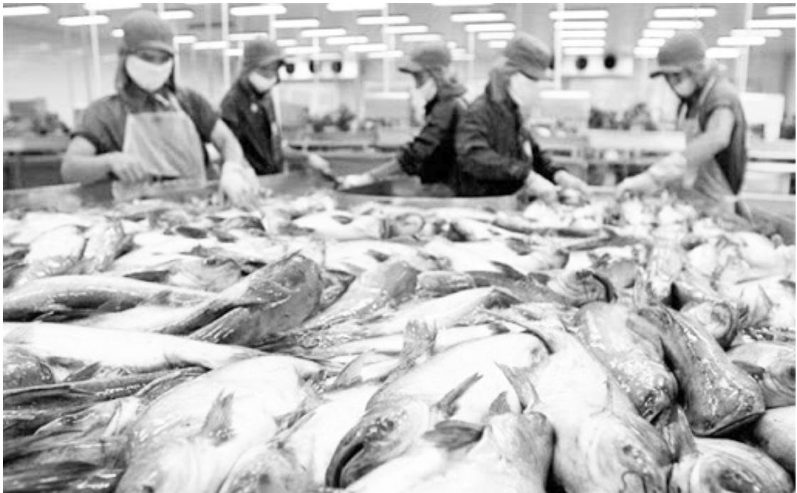
Trung Quốc đang đề nghị kiểm tra trực tuyến bảo đảm an toàn thực phẩm và các biện pháp phòng chống COVID-19 của một số doanh nghiệp chế biến thủy sản xuất khẩu.

Trong thời gian vừa qua, cơ quan thẩm quyền Trung Quốc cũng đã cảnh báo một số lô hàng tôm đông lạnh của Việt Nam nhiễm bệnh đốm trắng, bệnh hoại tử dưới vỏ và cơ quan tạo máu và một số chỉ tiêu an toàn thực phẩm.