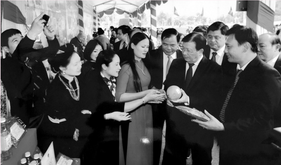
Phó Thủ tướng Trịnh Đình Dũng tham quan gian hàng của tỉnh Yên Bái

T rong khuôn khổ chương trình Hội nghị toàn quốc tổng kết, đánh giá kết quả thực hiện xây dựng nông thôn mới vùng đặc biệt khó khăn giai đoạn 2016-2020, tại Trung tâm Hội nghị tỉnh Yên Bái đã diễn ra hoạt động trưng bày các sản phẩm đặc trưng tham gia Chương trình OCOP, du lịch nông thôn của một số tỉnh khu vực miền núi phía Bắc và Bắc Trung Bộ.