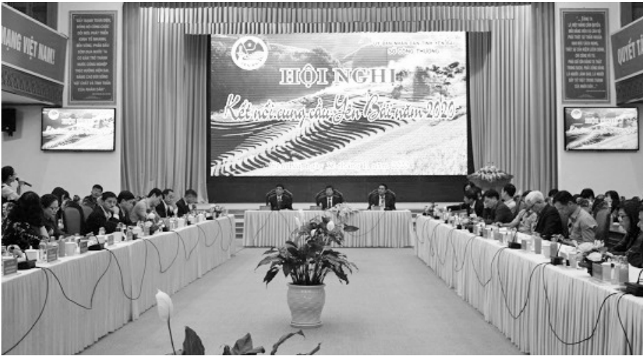
Quang cảnh hội nghị

rộng rãi, từng bước thâm nhập vào các kênh phân phối hiện đại và một số sản phẩm đã có mặt tại các thị trường lớn như: Hà Nội, các tỉnh, thành trong cả nước và được người tiêu dùng ưa chuộng.