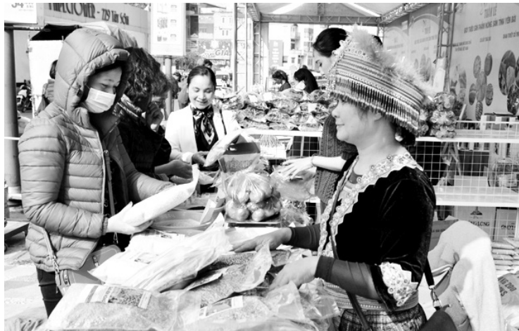
Người dân tham quan, mua sắm tại Tuần Lễ giới thiệu sản phẩm nông sản tỉnh Yên Bái.

Tuần lễ giới thiệu sản phẩm nông sản tỉnh Yên Bái diễn ra từ ngày 10 - 13/12