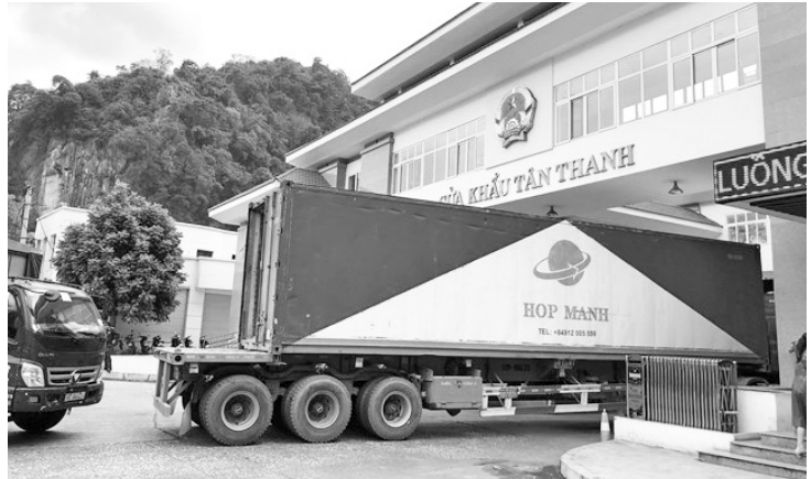
Thời gian thông quan sẽ kéo dài từ 8h-20h hàng ngày, bao gồm cả cuối tuần và ngày Lễ.

Thời gian tới, một số loại trái cây xuất khẩu của Việt Nam như thanh long, dưa hấu chuẩn bị bước vào cao điểm thu hoạch và xuất khẩu phục