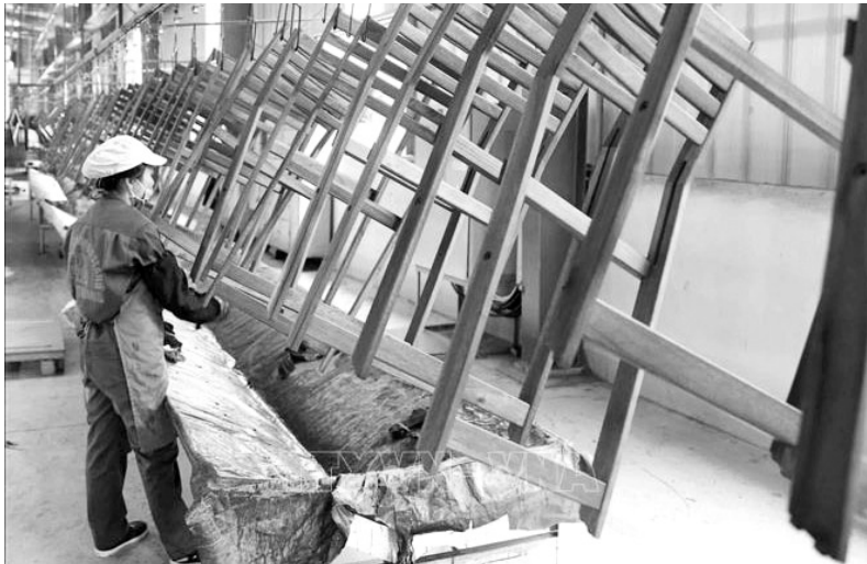
Gỗ và sản phẩm gỗ là ngành hàng có mức tăng trưởng xuất khẩu ấn tượng trong 11 tháng năm 2020. Trong ảnh: Kiểm tra, hoàn thiện sản phẩm bảo đảm tiêu chuẩn xuất khẩu sang thị trường EU tại Công ty cổ phần Woodsland Tuyên Quang.