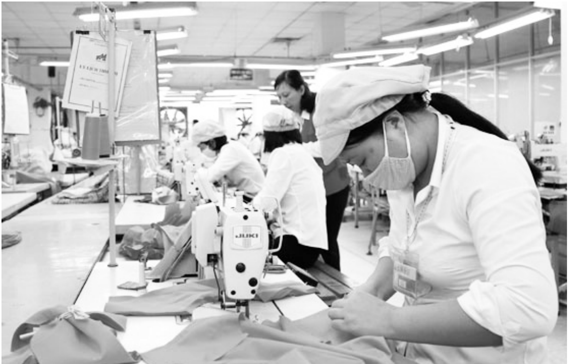
Sản xuất hàng may mặc xuất khẩu tại Tổng công ty May 10.