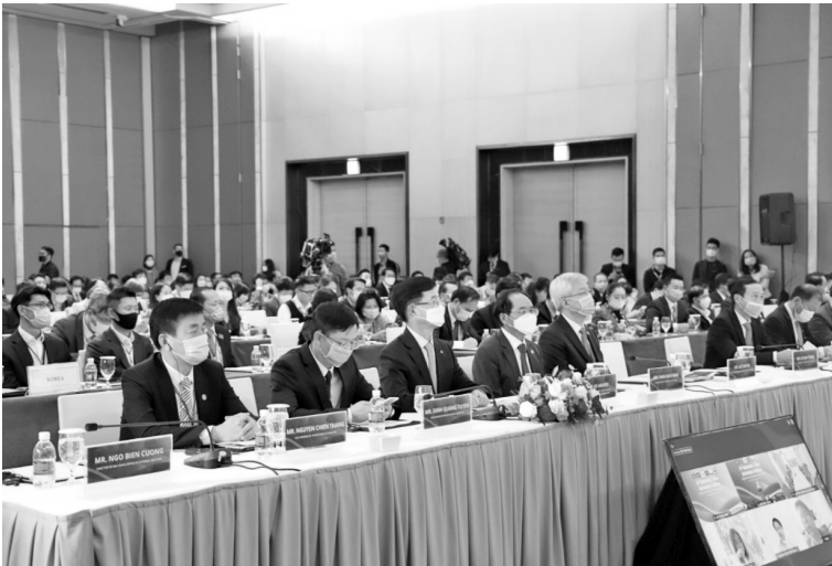
Đồng chí Nguyễn Chiến Thắng, Phó Chủ tịch UBND tỉnh (ngoài cùng bên trái) tham dự sự kiện

thiện điều kiện môi trường của khu vực dự án, giải quyết tình trạng ô nhiễm môi trường do nước thải gây ra; nâng cao chất lượng cuộc sống, thúc đẩy phát triển bền vững thành phố Yên Bái, góp phần vào sự phát triển chung của tỉnh Yên Bái.