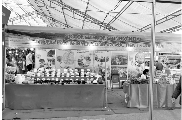
Gian hàng của Trung tâm KC&XTTM tỉnh Yên Bái tham gia Hội chợ

Với mục đích hỗ trợ cho các đơn vị, doanh nghiệp, hợp tác xã của tỉnh Yên Bái quảng bá, giới thiệu sản phẩm, giúp tăng cường liên doanh, liên kết, phát triển sản xuất nông nghiệp, mở rộng mạng lưới phân phối, tiêu thụ sản phẩm giữa tỉnh Yên Bái với khu vực miền núi phía Bắc và cả nước. Trung tâm Khuyến công và Xúc tiến thương mại – Sở Công Thương tỉnh Yên Bái đã phối hợp với các đơn vị liên quan tổ chức 02 gian hàng tiêu chuẩn để tham gia Hội chợ “Mỗi xã, phường một sản phẩm” tỉnh Thái Nguyên năm 2020. Các mặt hàng chủ lực được trưng bày tại gian hàng là những sản phẩm nông