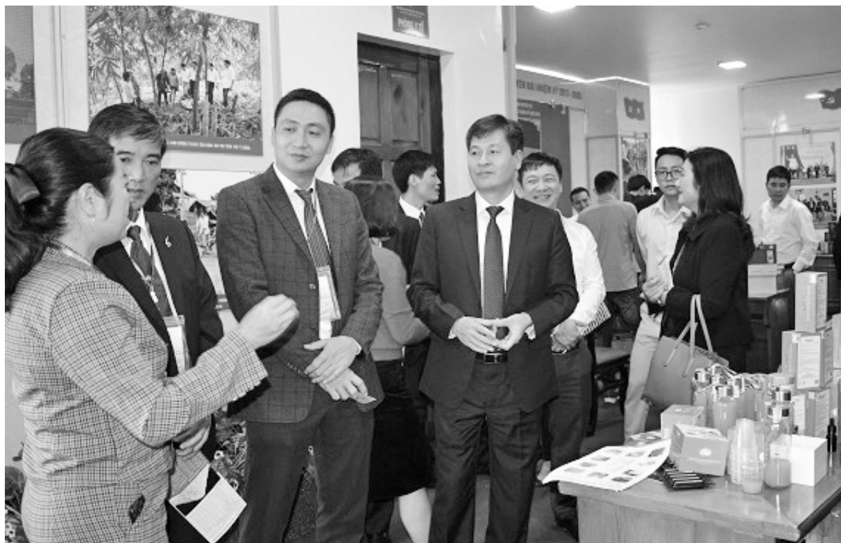
Đồng chí Ngô Hạnh Phúc - Phó Chủ tịch UBND tỉnh và các đại biểu tham quan các gian hàng trưng bày sản phẩm của các tỉnh.

Thông qua hoạt động XTTM nhiều sản phẩm đặc sản của Yên Bái được quảng bá